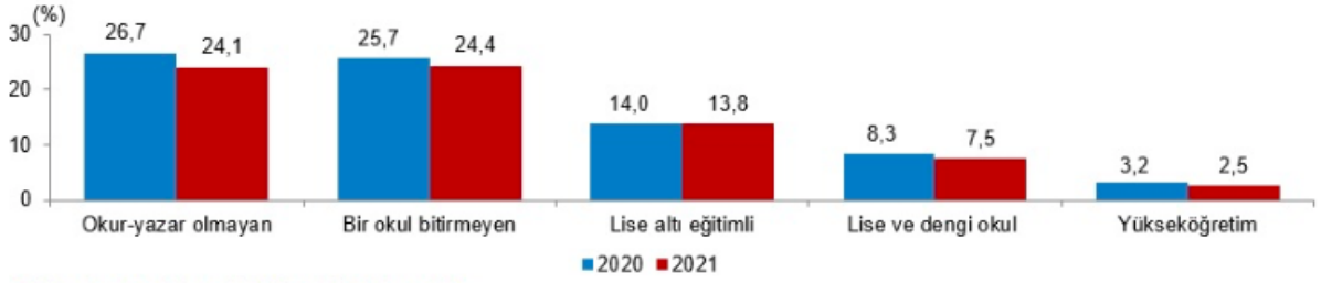
Eđitim durumuna gre yoksulluk oranı (%), 2020, 2021